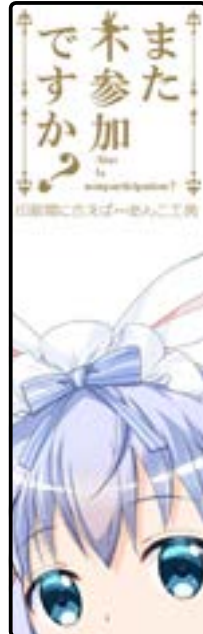
嫁 35 あんこ工房 あんこ