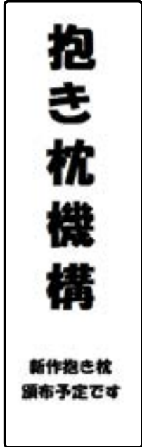
嫁 17 抱き枕機構 枕投げ野郎