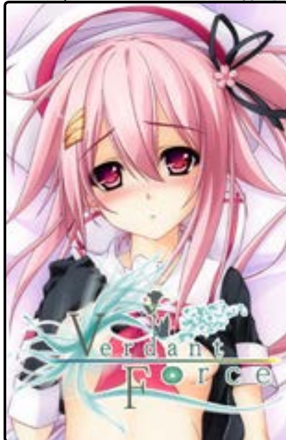
Verdant Force 葵 比呂