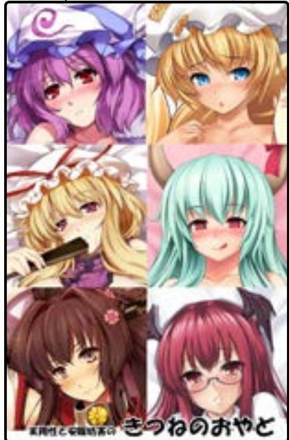
きつねのおやど 松山やよい