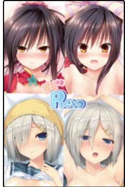
すくすくレヴォリューション すくすく君